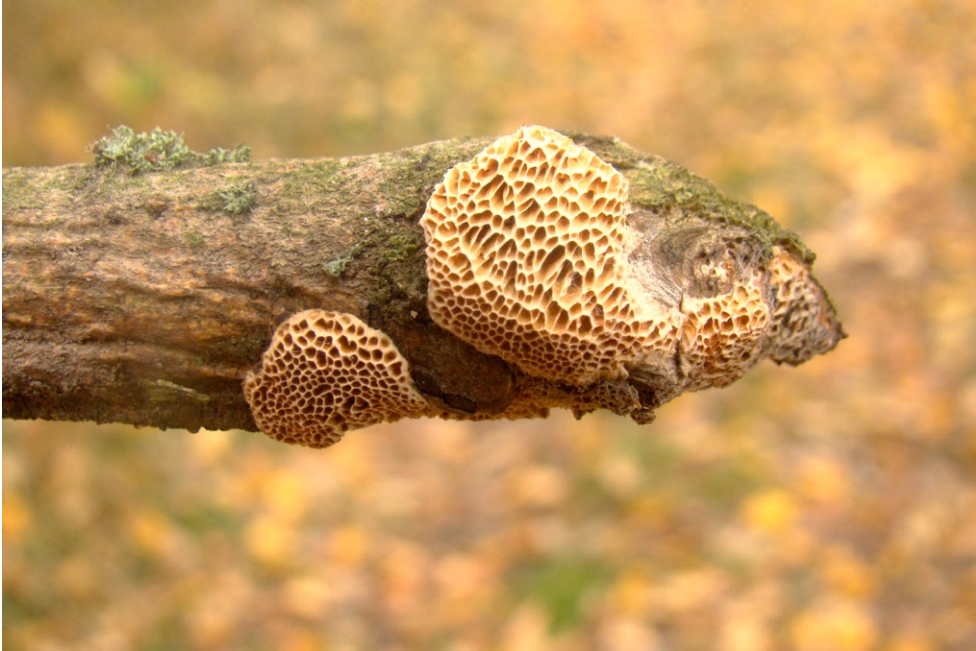
Fot. 3. Antrodia macra. Photo 3. Antrodia macra.

ny (buk, dąb, sosna); drewno; MWR; fot., zieln. (ZBŚRiL PAN, 6/MWR/21.03.12); ID: 194469.