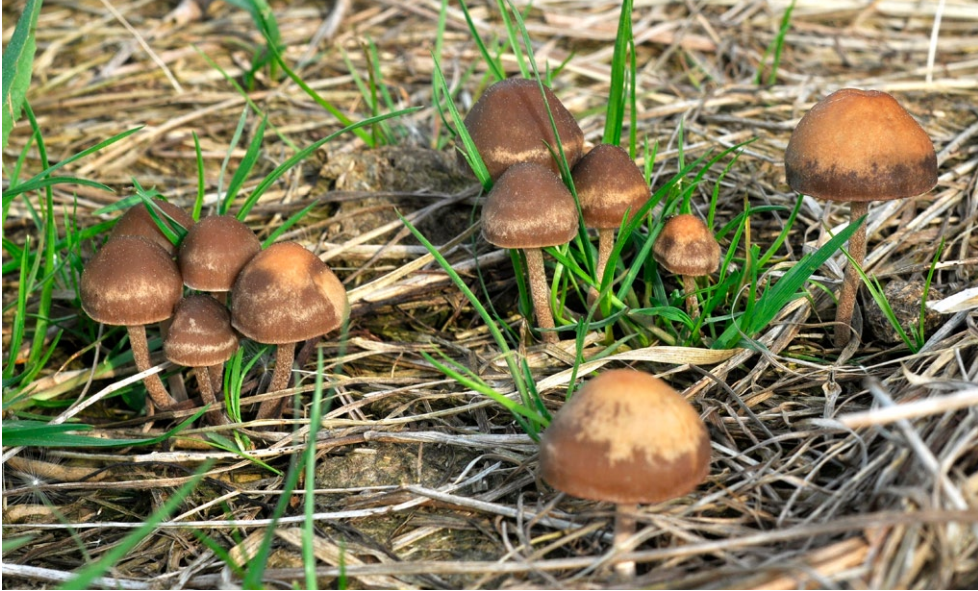
Fot. 16. Panaeolus olivaceus. Photo 16. Panaeolus olivaceus.