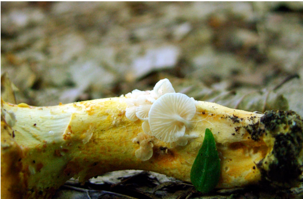
Fot. 10. Entoloma parasiticum. Photo 10. Entoloma parasiticum.

1. Pojaworek, 0,7 km NW, pow. wieruszowski, LD, CE-37; 16.10.2011; las liściasty; pniak dębowy; PZ; fot.; ID: 192495.