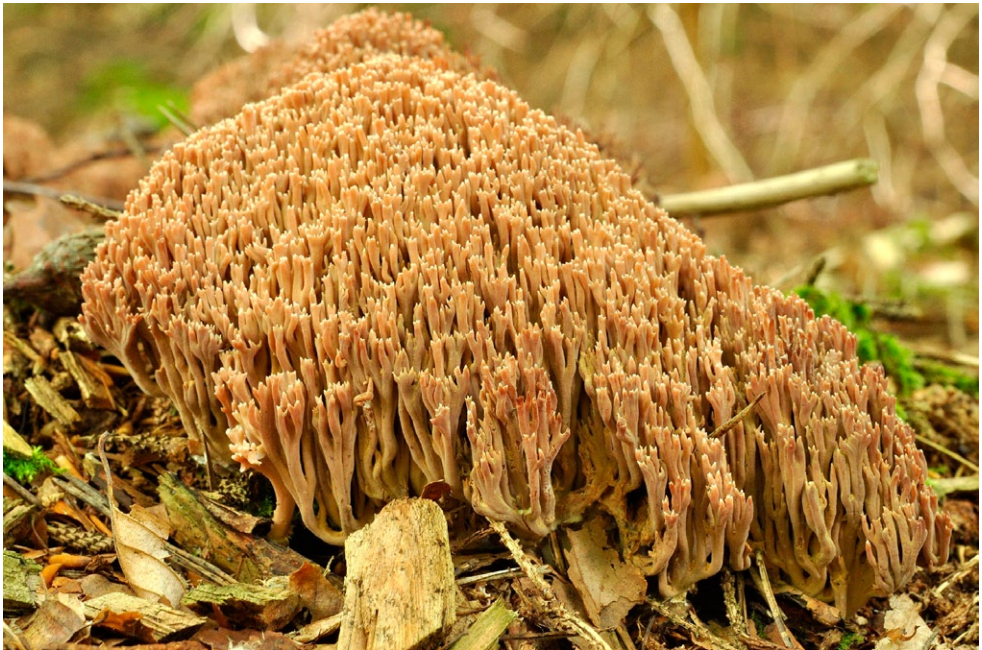
Fot. 21. Ramaria rubella.

1. Gdańsk, Gdańsk-Oliwa, pow. Gdańsk, PM, TPK, ok. L. Renuszewo, CA-89; 01.08.2012; las bukowy z domieszką sosny i dębu; ziemia; MWR; BG; fot., zieln. (BGF/BF/MWR/120801/0004); ID: 210107.