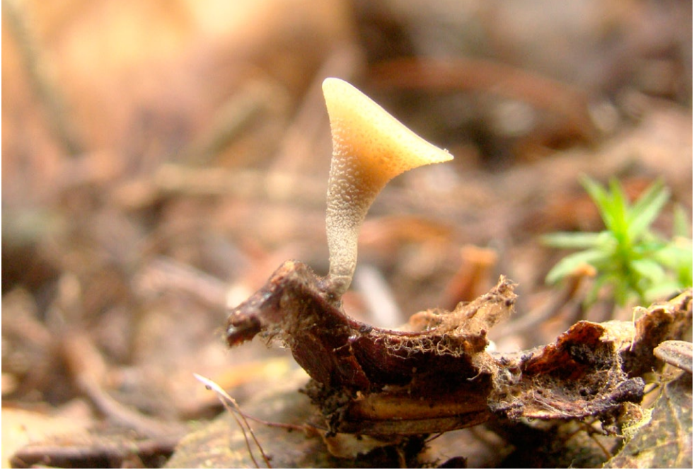
Fot. 24. Ciboria rufofusca. Photo 24. Ciboria rufofusca.

G. pectinatum (209951), G. quadrifidum (210934, 227795), G. rufescens (209952), G. striatum (209953, 211488, 213983), G. triplex (226616, 227039), Gomphidius roseus (173979), Helvella leucomelaena (213114), Hericium flagellum (196026, 227796), Hydnellum compactum (211489, 228858), Hygrophorus russula (227940), Hymenochaete tabacina (192958), Lactarius bertillonii (187789, 201084, 220370), L. chrysorrheus (196215, 205934, 207282, 227947, 228860), L. controversus (194490), L. lilacinus (192236), L. trivialis (208963), Lentinus cyathiformis (204926), L. suavissimus (220944), Lepiota ventriospora (217794), Lycoperdon echinatum (203711), Morchella conica (213184), M. esculenta (213748), M. gigas (185387, 185388, 213195, 213410), Mutinus ravenelii (227931), Mycenastrum corium (204225), Paxillus rubicundulus (205941, 210935), Peniophora polygonia (184815), Phaeomarasmius erinaceus (201892), Pholiota adiposa (207157), Ptychoverpa bohemica (164120,