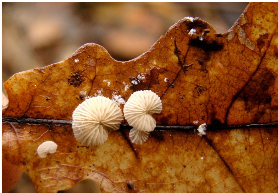
Fot. 9. Crepidotus epibryus. Photo 9. Crepidotus epibryus.