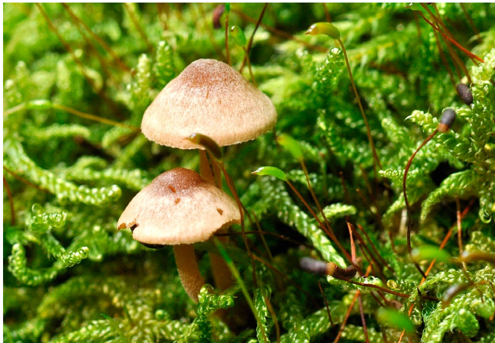
Fot. 14. Inocybe petiginosa. Photo 14. Inocybe petiginosa.