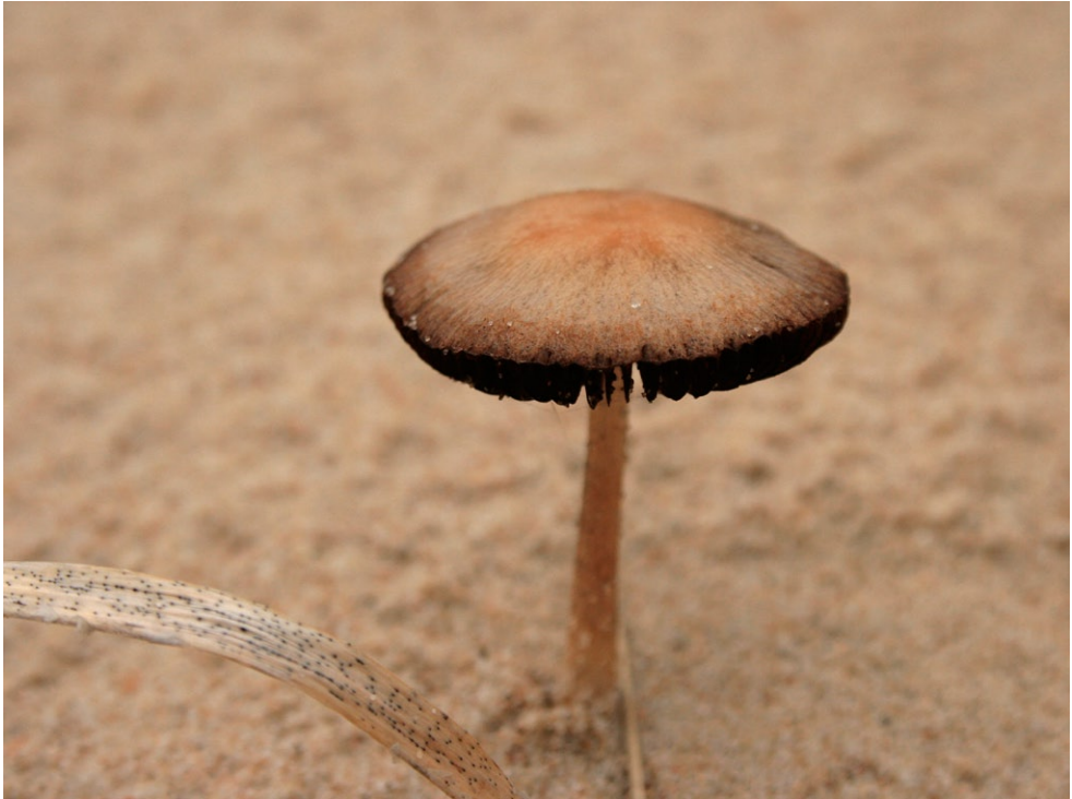
Fot. 19. Psathyrella ammophila. Photo 19. Psathyrella ammophila.

1. Drewniaczki, pow. starogardzki, PM, Bory Tucholskie, CB-49; 07.10.2012; las mieszany (buk, sosna, brzoza, świerk, dąb); ziemia; MWR; BG; fot., zieln. (BGF/BF/MWR/121007/0003); ID: 210120.