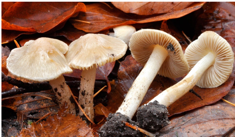
Fot. 15. Inocybe sindonia. Photo 15. Inocybe sindonia.