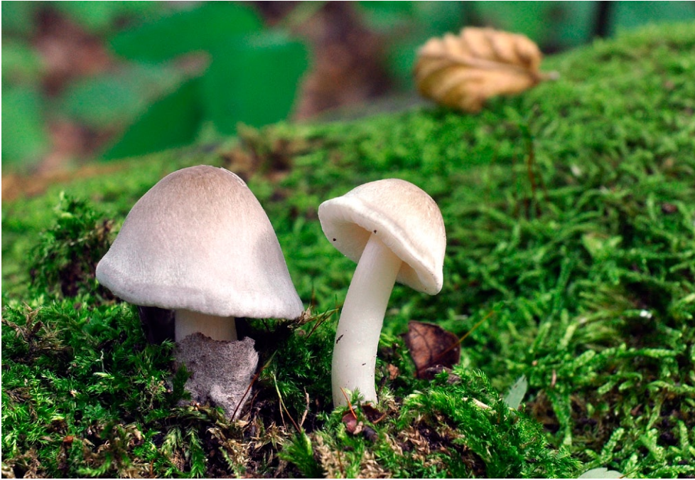
Fot. 23. Volvariella caesiotincta. Photo 23. Volvariella caesiotincta.