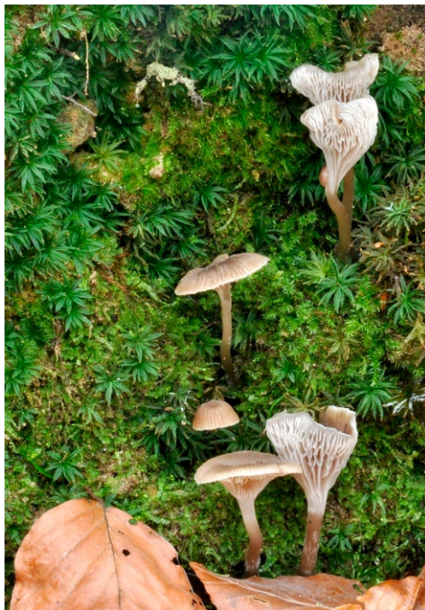
Fot. 11. Fayodia gracilipes.

Photo 11. Fayodia gracilipes.