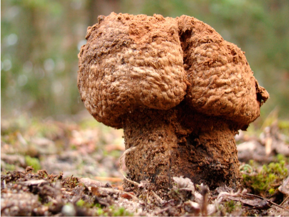
Fot. 18. Pisolithus arrhizus. Photo 18. Pisolithus arrhizus.