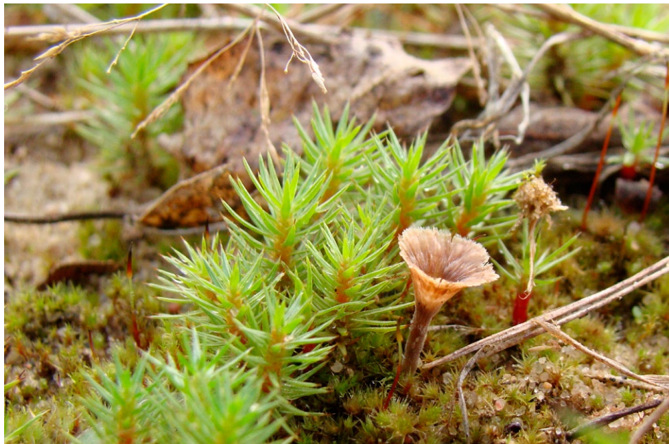
Fot. 8. Cotyldia undulata. Photo 8. Cotyldia undulata.