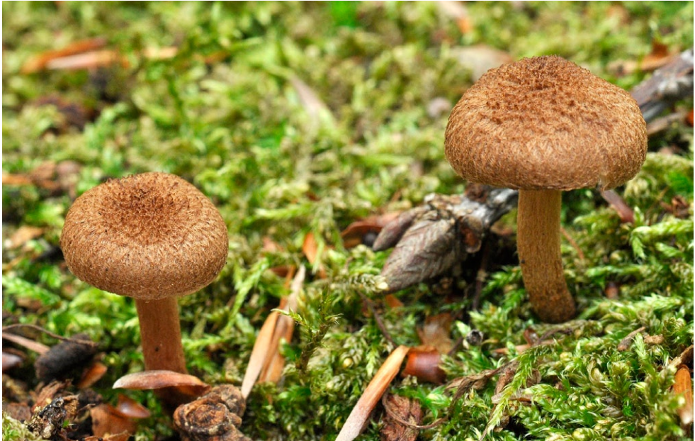
Fot. 13. Inocybe leptophylla. Photo 13. Inocybe leptophylla.