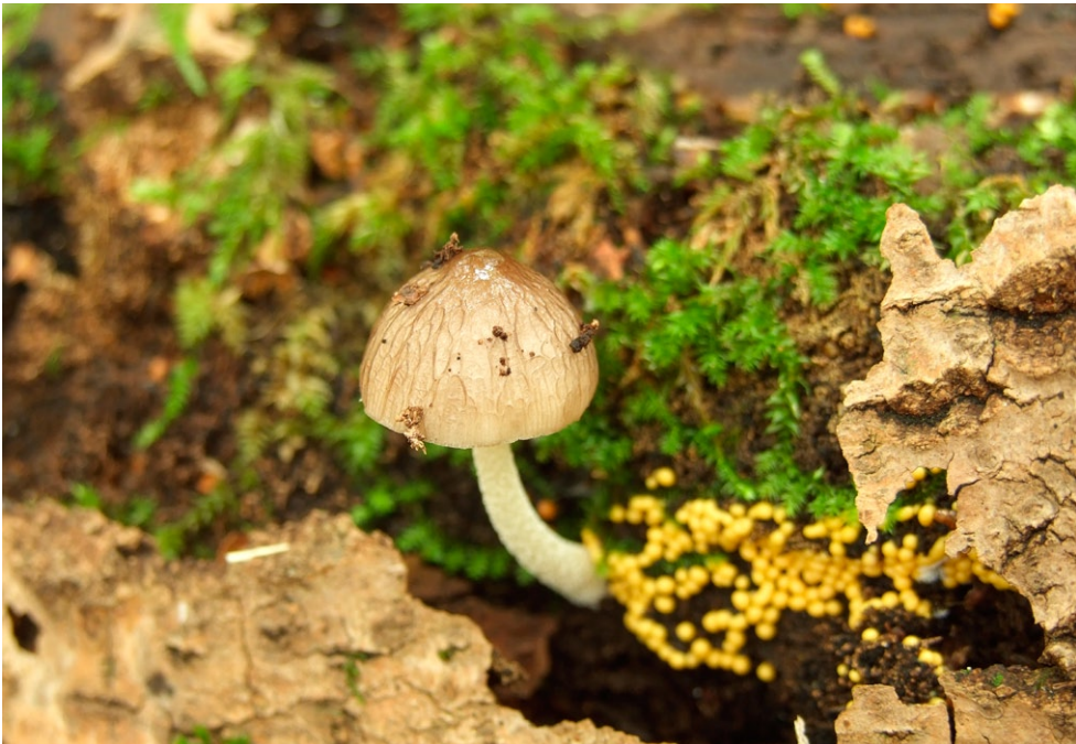
Fot. 5. Bolbitius reticulatus.

1. Poznań, Poznań-Nowa Wieś Dolna, 0,6 km NW, pow. Poznań, WP, BC-99;