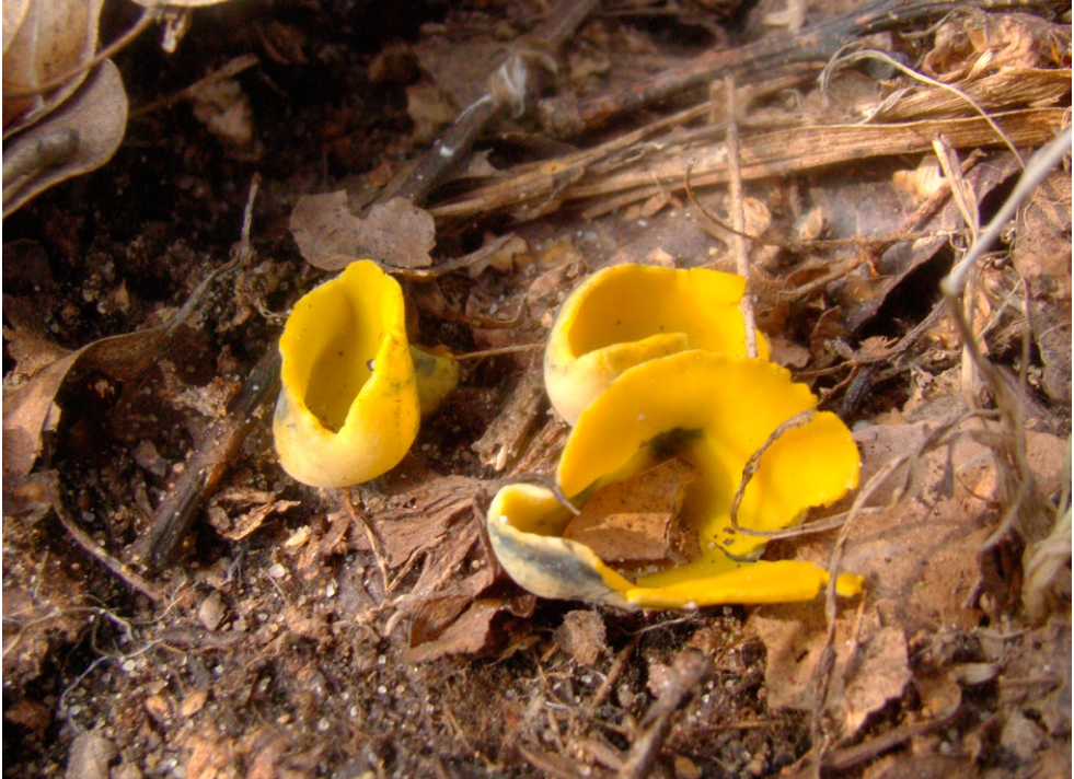
Fot. 1. Caloscypha fulgens. Photo 1. Caloscypha fulgens.

ziemia; JN; fot., zieln. (ZBŚRiL PAN, 4/JN/31.07.13); ID: 212946.