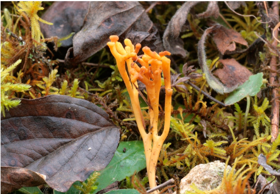
Fot. 22. Ramariopsis crocea.

1. Gryżyna, 1 km SWW, pow. krośnieński, LS, AD-27; 11.10.2008; skraj boru sosnowego ( Leucobryo-Pinetum ); ziemia; TŚ; fot., zieln. (TŚ, sine num.); ID: 153262.