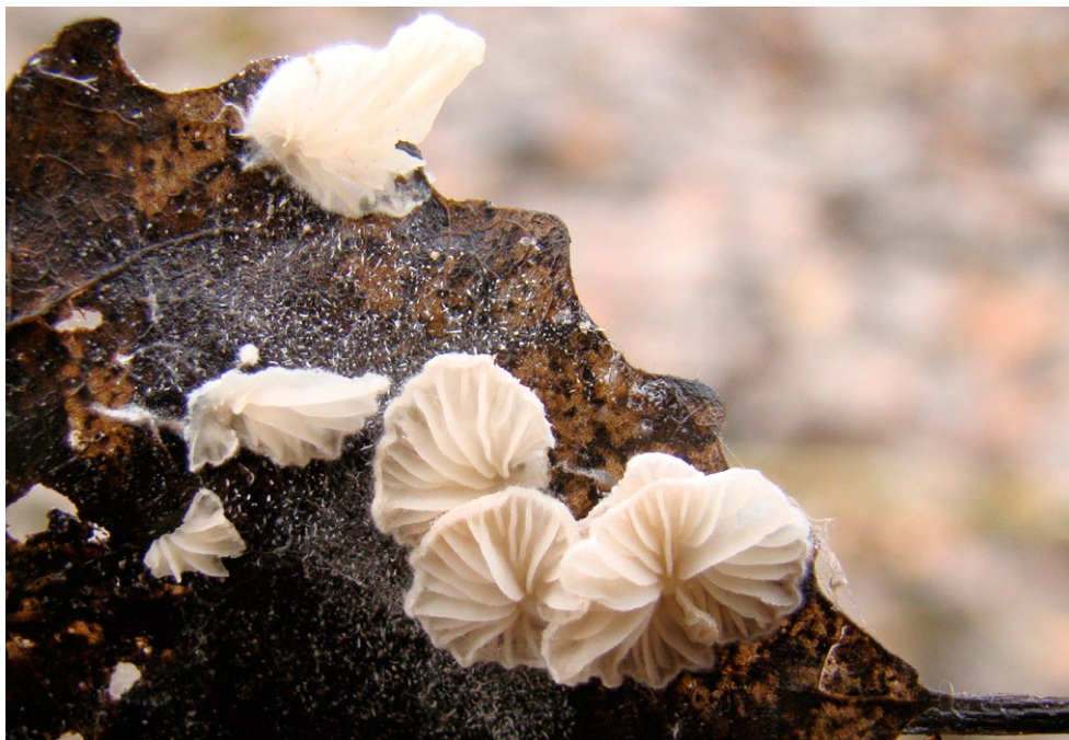
Fot. 7. Clitopilus daamsii. Photo 7. Clitopilus daamsii.