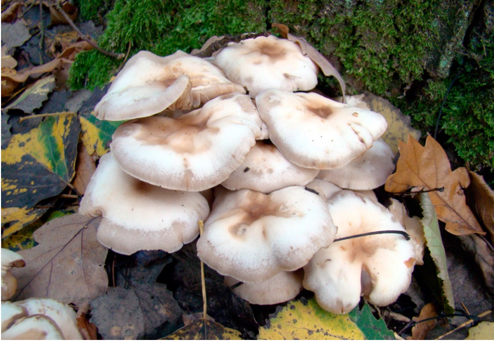
Fot. 20. Psathyrella spadicea.

Photo 20. Psathyrella spadicea.