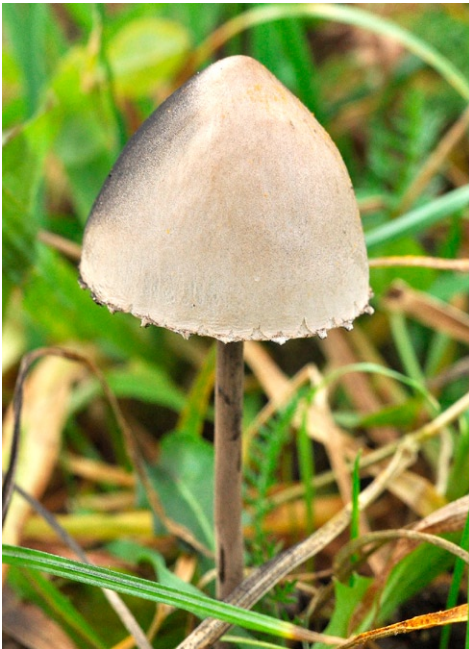
Fot. 17. Panaeolus papilionaceus. Photo 17. Panaeolus papilionaceus.

2. Poznań, Poznań-Piątkowo, pow. Poznań, WP, BC-98; 04.07.2012; trawnik osiedlowy; ziemia; ASz; fot., zieln. (ASz E-20120704); ID: 204226.