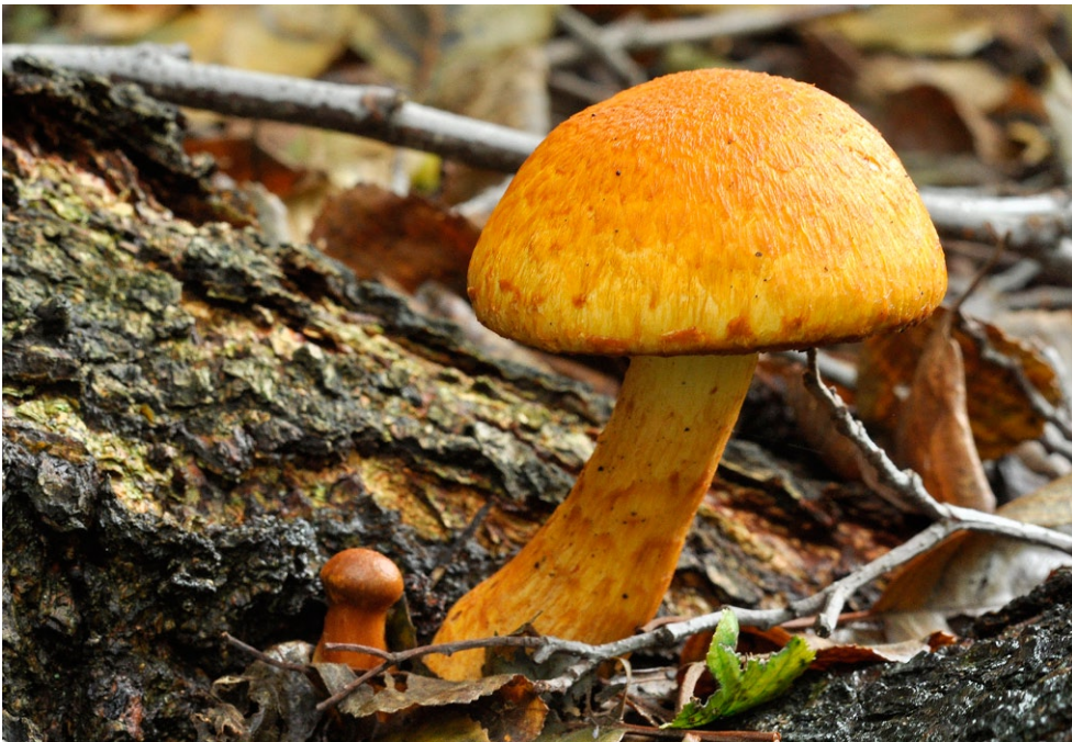
Fot. 12. Gymnopilus junonius. Photo 12. Gymnopilus junonius.

4. Kalisz Kaszubski, pow. kościerski, PM, CB-25; 22.09.2012; las sosnowy; drewno sosnowe; MWR; fot., zieln. (BGF/BF/MWR/120922/0004); ID: 206517.