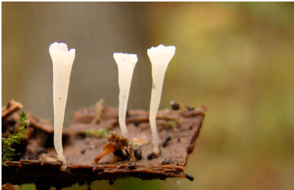
Fot. 6. Clavicornona taxophila. Photo 6. Clavicornona taxophila.