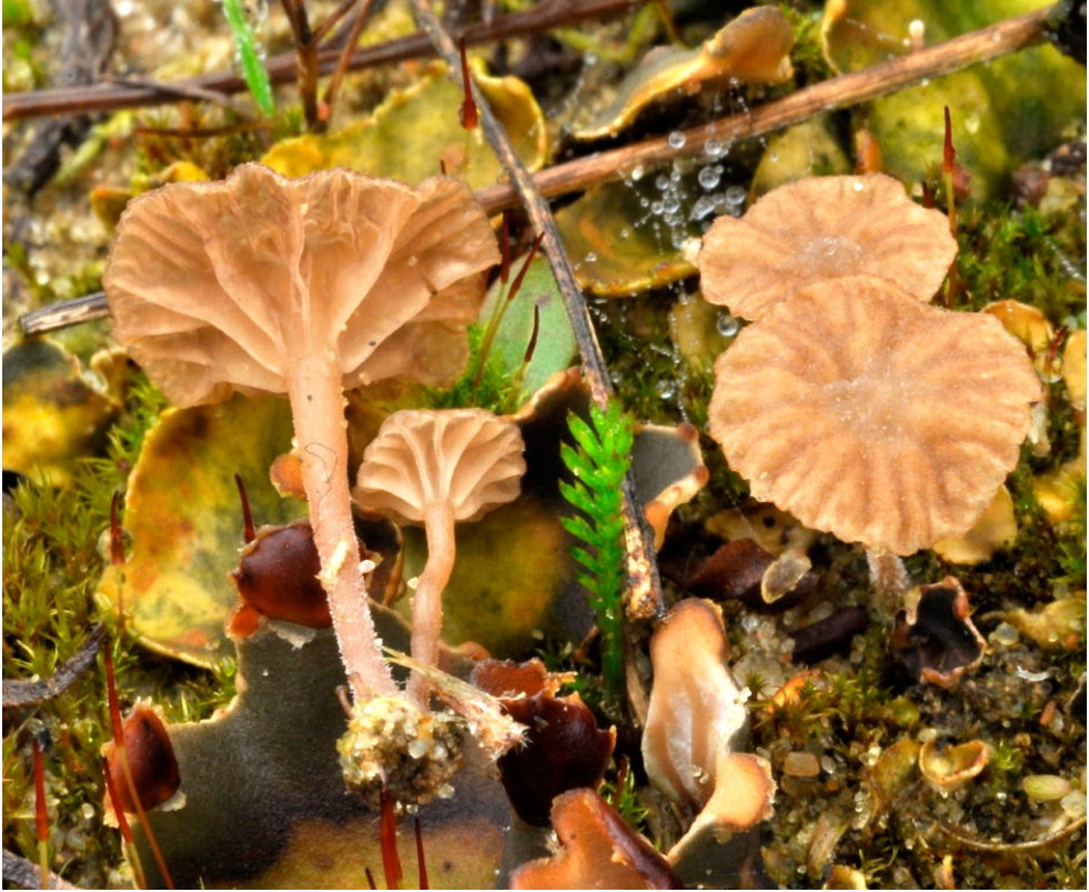
Fot. 4. Arrhenia peltigerina.

Photo 4. Arrhenia peltigerina.