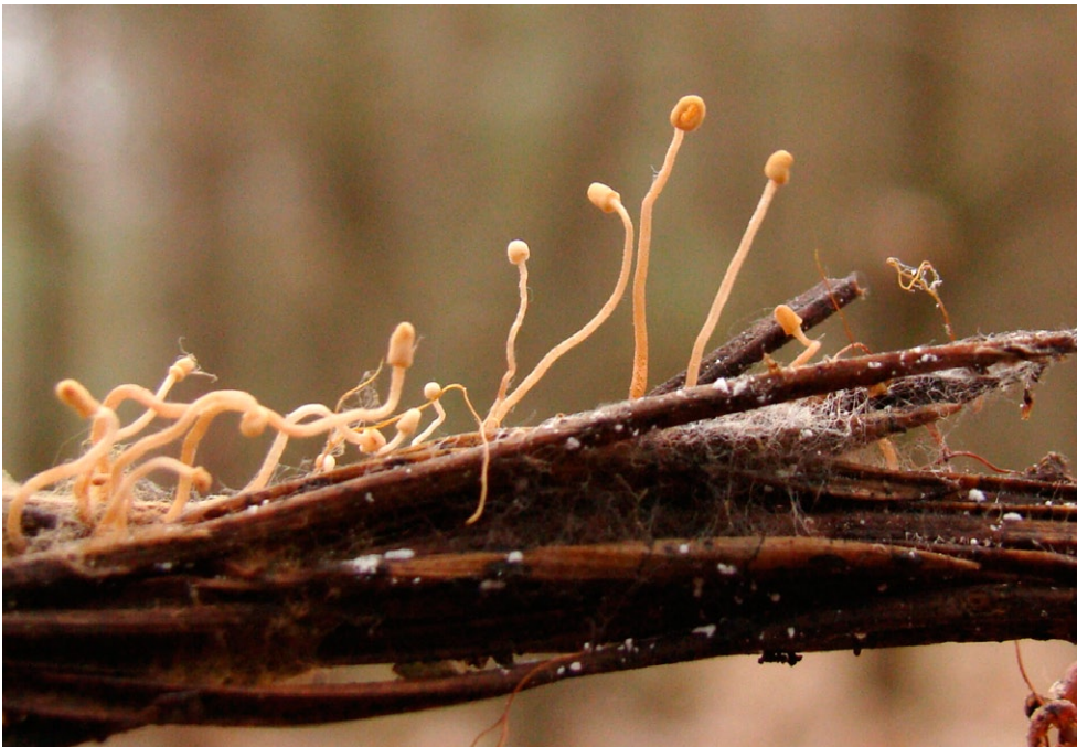
Fot. 2. Heyderia pusilla.

2. Stobiecko Szlacheckie, 0,8 km N, pow. radomszczański, LD, DE-45; 31.10.2012; skraj lasu mieszanego (sosna, brzoza); ściółka; JN; AK; fot., zieln. (ZBŚRiL PAN, 28/JN/28.12.13); ID: 209880.